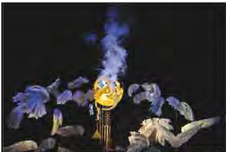
Still life with a glowing orb, 1988, by J. M. W. Turner